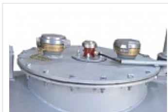
Обвязка горловины ёмкости