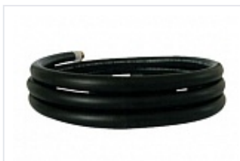
Шланги для ТРК