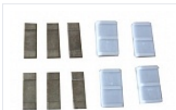
Лопатки к эл.насосным блокам