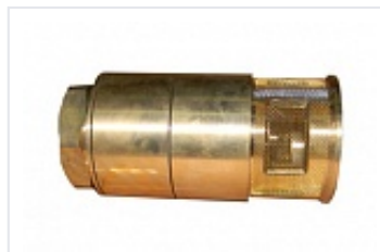
Клапан обратный с фильтром